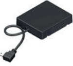
NOVOFERM HOMEMATIC IP MODUL