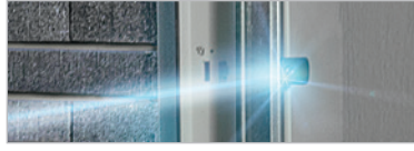
LICHTSCHRANKE FÜR GARAGENTORE